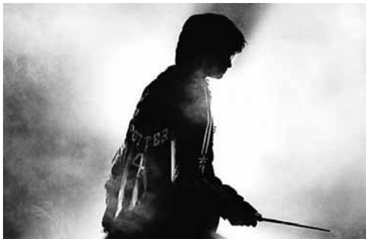
Daniel Radcliffe sera Harry Potter, le 30 novembre au ciné.

Le quatrième tome au ciné le 30 novembre